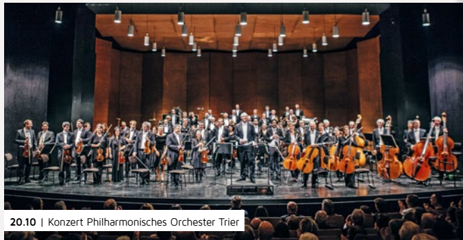
20.10 | Konzert Philharmonisches Orchester Trier