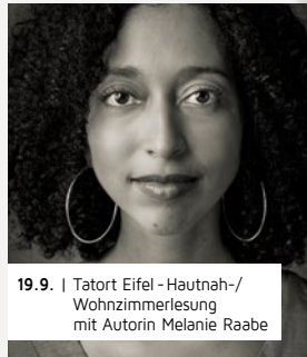
19.9. | Tatort Eifel - Hautnah-/Wohnzimmerlesung mit Autorin Melanie Raabe