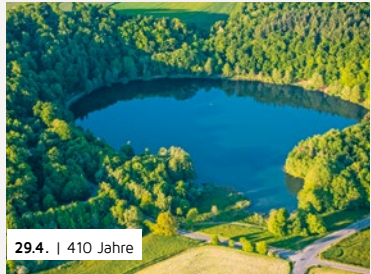
29.4. | 410 Jahre